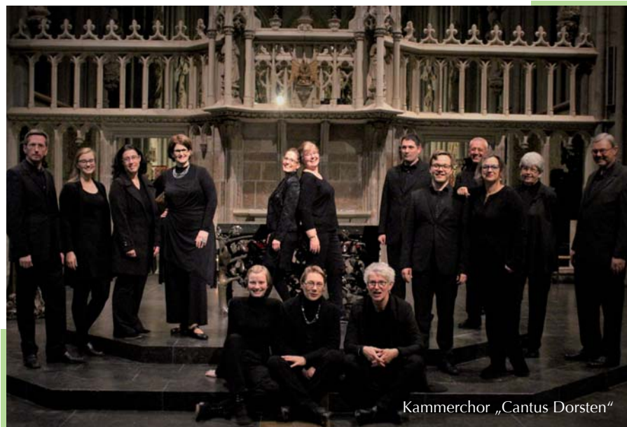
Kammerchor „Cantus Dorsten“