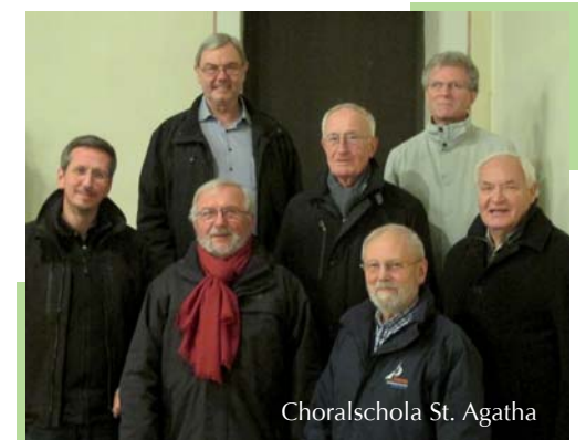
Choralschola St. Agatha